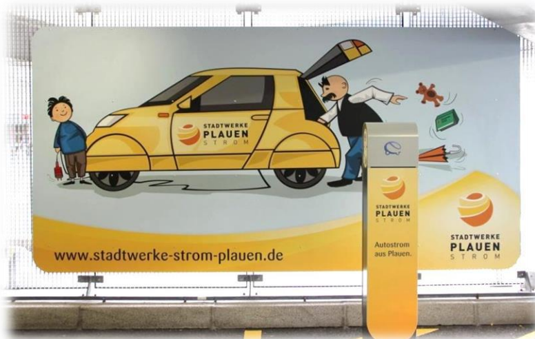
Ladesäule Parkhaus Stadt-Galerie