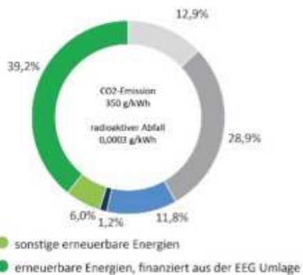
Unser Gesamtenergieträgermix (ohne Anteil Erneuerbare Energien, finanziert aus der EEG-Umlage)